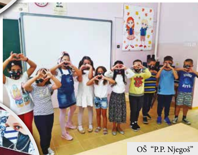
OŠ „P.P. Njegoš“

-Kako bi učenicima u promenjenim uslovima bilo prijetnije i da bi bolje razumeli i prihvatili propisane mere pripremili smo im afirmativne vizuelne poruke tematski grupisane. Od 'Maski kroz istoriju', na platnu, književnosti, animiranom i igranom