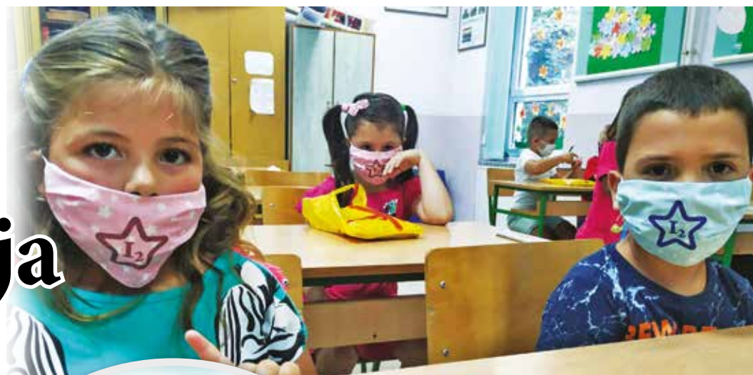
OŠ „Bratstvo jedinstvo“

U školama u Zmajevu, Bačkom Dobrom Polju i u vrbaškoj školi „Bratstvo jedinstvo“ redovna nastava organizovana je za sve učenike od prvog do osmog razreda. Imajući u vidu da se u većini škola učenici viših razreda smenjuju dnevno ili nedeljno pohađajući naizmenično online i redovnu nastavu, u školi „Bratstvo jedinstvo“ zadovoljni su što su uspeli za sve učenike da organizuju nastavu. „Na samom početku sve dobro