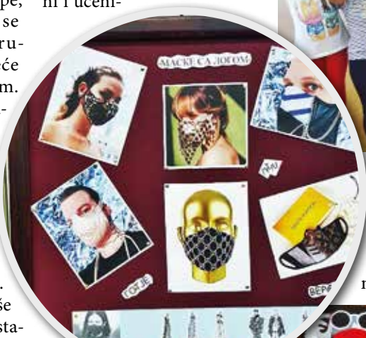
SSŠ „4. juli“

funkcioniraju, nadam se da će tako i ostati. Svi smo dežurni na odmorima, u školi dočekujemo i ispraćamo učenike. Već smo se svi uhodali i zaposleni i učeni-