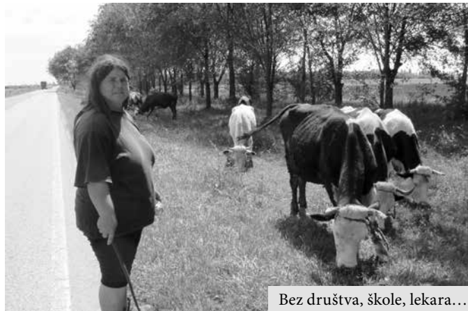
Bez društva, škole, lekara...

vanje. Svako od krava nade nule su po ime i nestvarno ih čuvaju, kao da svaka zna svoje ime, a u stadu imaju Nikolinu, Čanu, Marušku, Milku, Bojanu, Ružu, Bobicu, Jelu, Jagodu, Betu, Pepeljugu... i čobanice priupita tri žene, kako su i da