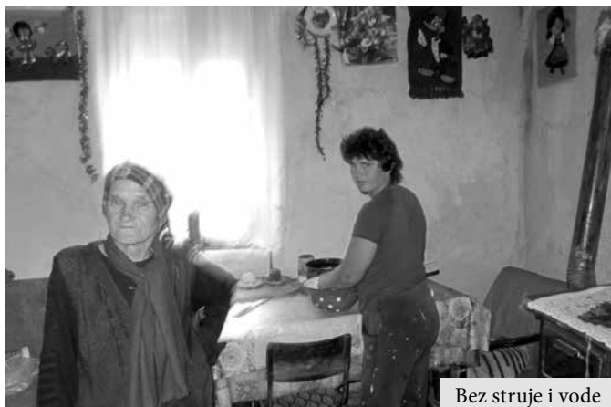
Bez struje i vode

le, nikada nisu išle u kafice, niti kupovale garderobu, spremale se za grad, nisu imale društvo... Sa prvim sumrakom idu u kuću zemlju bez radia, televizije, bez struje, na spavanje, a onda ujutro rano izvedu svoje krave pored autoputa na ču-