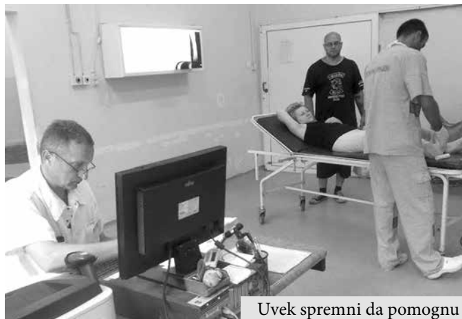
Uvek spremni da pomognu

menu. Dosta toga, uključujući i vozila za transport, nije zadržano još od kada je odeljenje formirano.