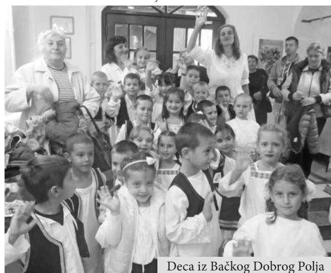
Deca iz Bačkog Dobrog Polja

Dečja nedelja ove godine održana je pod motom "Neću da brigam, hoću da se igram" od 3. do 9. oktobra. Veselo je