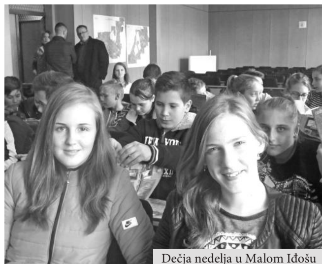
Dečja nedelja u Malom Idošu