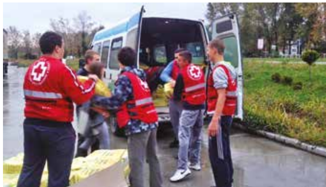
Mlađi volonteri CK Kula pomažu u raspodeli pomoći

Uz odliv mladih povećava se broj starih i nemoćnih, besparica čini svoje, a resursi se troše i tanje. Ipak, nije sva pomoć