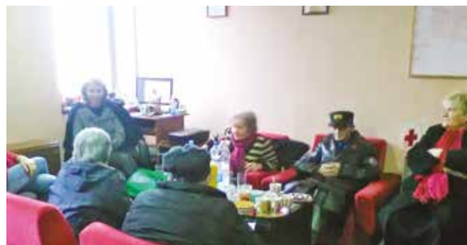
Stariji volonteri CK Vrbasa razrađuju plan budućih akcija

„Izuzetno smo ponosni na naše sugrađane koju svoju humanost pokazuju kroz naše humanitarne akcije, akcije dobrovoljnog davalštva krvi, sabirne akcije u cilju pomoći najugroženijem stanovništvu. Kroz naš posao imali smo priliku da vidimo njihovu konstantnu empatiju, solidarnost i humanost na delu,