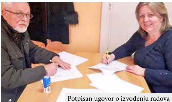
Potpisan ugovor o izvođenju radova

U Ekonomsko trgovinskoj učionica, među kojima će biti još jedan biro za rad virtuelnih preduzeća u kojem učenici sa nastavnicima simuliraju rad u realnom preduzeću. Gradivni rad u realnom preduzeću. Gradi se još jedan sanitarni čvor za učenike i jedan za potrebe invalida. Prizemlje Ekonomsko-trgovinske škole će na ovaj način biti prilagođeno i osobama sa invaliditetom jer će na novom ulazu za učenike biti