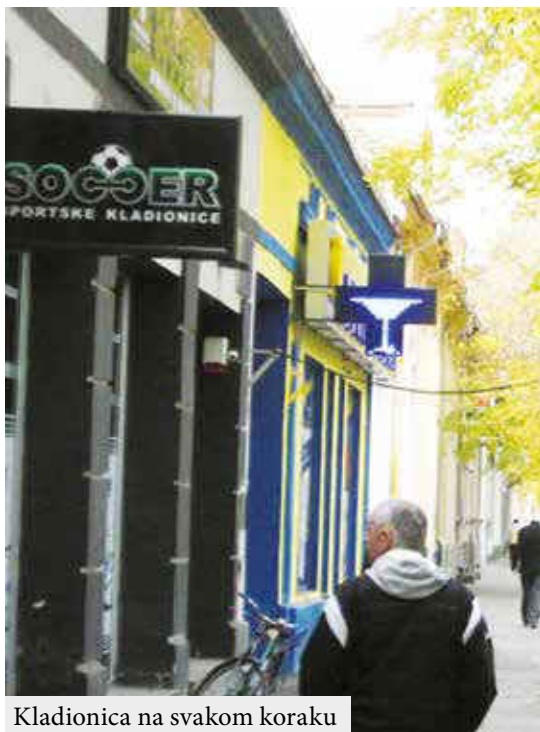
Kladionica na svakom koraku

Ta su mesta najveći domet naše kulture kod našeg naroda. To je prosto zastrašujuće, zastrašujuće žalosno i za mlade i za stare. Na žalost kladionice posećuju sve generacije, od 16 do 65 godina, ovi brojevi bi možda mogli da budu i brojevi neke dobitne kombinacije, šalim se. Ali sve što imam da kažem, užas, ili no koment.