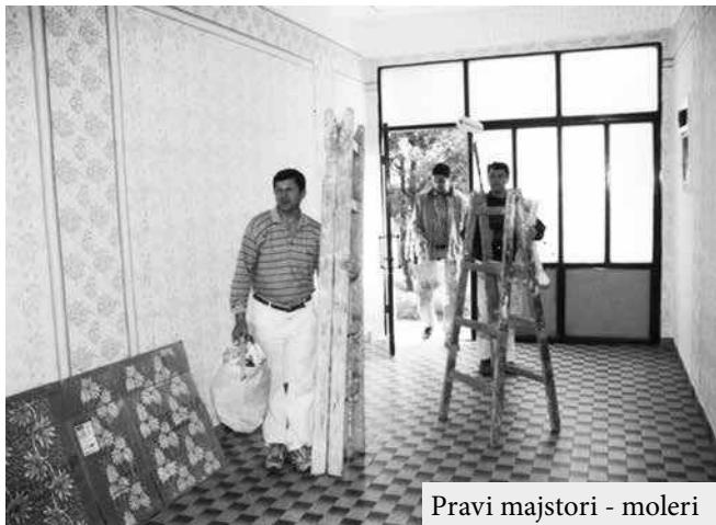
Pravi majstori - moleri

Kucura se može nazvati radnikom molera, ako je suditi po njihovoj brojnosti. Ovde