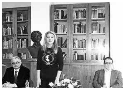
Dan Biblioteke "Danilo Kiš" Vrbas