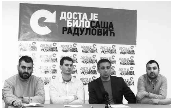
Konferencija za novinare DJB

praktično se ništa pozitivno za građane nije dešavalo. Stanje u gotovo svim javnim preduzećima vo ako su u pitanju socijalno ugroženi stanovnici. Pokušaćemo da ustalimo zarade za-