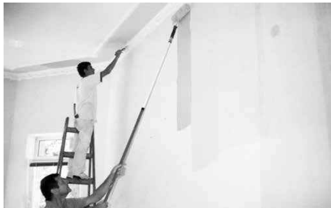
Nikada se nije posvađao ni sa radnikom ni sa mušterijom