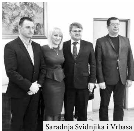
Saradnja Svidnjika i Vrbasa