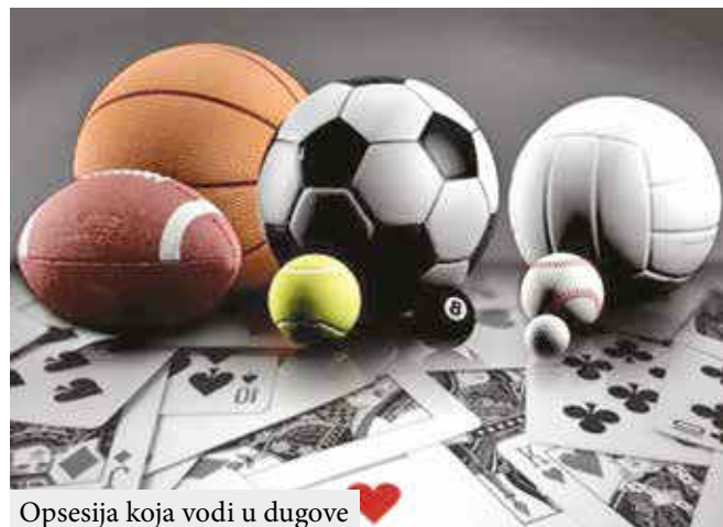
Opsesija koja vodi u dugove