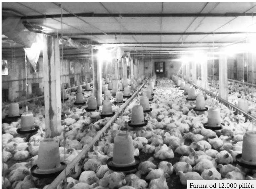
Farma od 12.000 pilića

logu, potom prodavnice, a jedno vreme je imao i farmu svinja, ali ja se ne bojim rada, a ni konkurencije”, kaže Miodrag. A da je išlo sve glatko da se dođe do ovog cilja, kaže da nije. Devedestih godina prošlog veka u vreme krize napušta