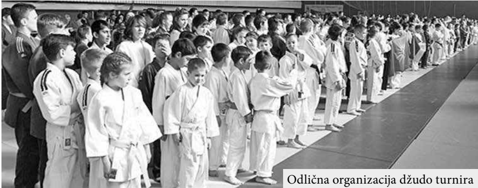
Odlična organizacija džudo turnira

Preko četiristotine takmičara domaćini, a naša opština je tista džudo sporta, internacijakupilo se u Srbobranu na 19. imala čast da ugosti sve ove onalac i osvajač prve olimpijMedunarodnom džudo turni- takmičare”, rekao je Lazar Ga- ske medalje za našu državu u