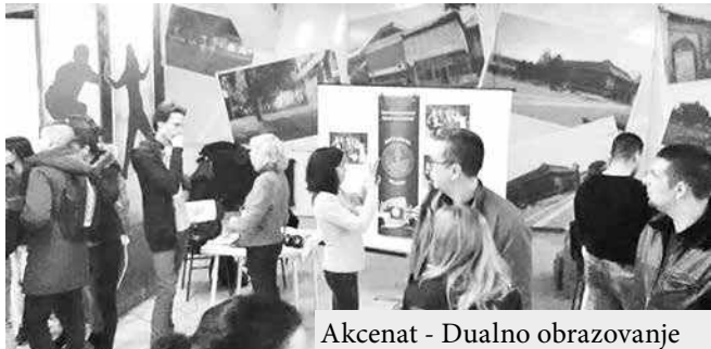
Akcentat - Dualno obrazovanje

Pod sloganom „Upoznaj svet zacije obnove objekta OŠ ‘P.P. Njegoš’ vredne blizu 40 milio-