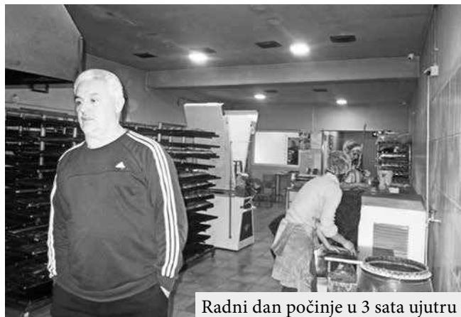
Radni dan počinje u 3 sata ujutru

mного ljudi u ovom gradu je ostalo bez posla. Ljudi nema- mu pa do danas imao je mnogo ulaganja, proširio je objekat,