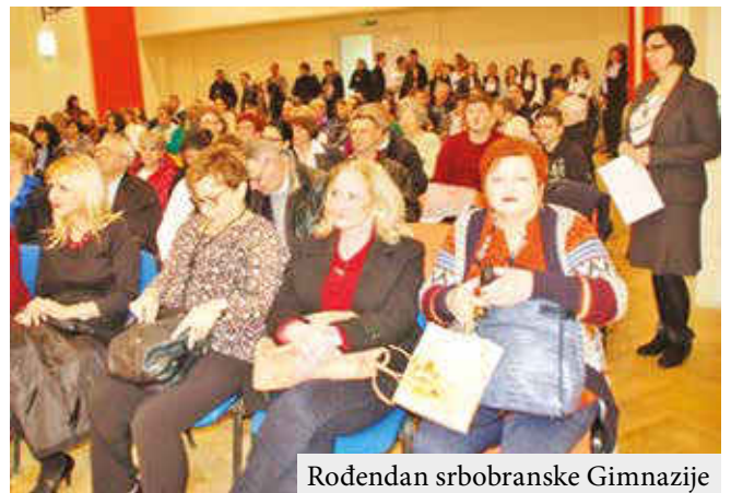
Rođendan srbobranske Gimnazije