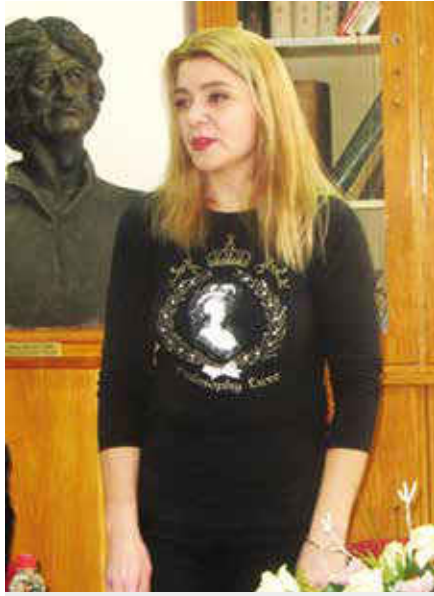
Direktorka vrbaskе Biblioteke

Koliko god da ima knjiga u osim toga što je radila prošle godine reviziju dečijeg knjižnog fonda, radila je na renoviranju Odeljenja biblioteke u li iz godine u godinu da povećamo i proširimo taj knjižni fond, poznato je da se sve knjige ne mogu pročitati, kaže direktorka. „Zato smo i radili sijaset tribina, književnih večeri i na taj način našoj čitalačkoj publici pružali priliku da saznaju nešto novo, da čuju za neku drugu ili najnoviju knjigu“. Prilikom nabavki knjiga vodilo se računa da tu budu zastupljena osim beletristike i naučna dela, razni stručni časopisi, ali nikako nije zaboravljena dečija književna publika. „Organizovali smo dečije literarne, likovne konkurencije i podsticali to zanimanje i interesovanje za knjigu, obrazovanje i umetnost“, kaže direktorka. Vrbaska Biblioteka