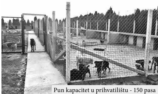
Pun kapacitet u prihvatilištu - 150 pasa

svesni ovog problema i svakodnevno rade na rešavanju, ali im je delovanje ograničeno. „U prihvatilištu se nalazi 150 pasa, što znači da su popunjeni kapaciteti, a procena je da na ulicama u opštini ima još blizu stotinu pasa lutalice. Kao što bolnica ima kapacitet ležajeva i ne može da primi pacijente