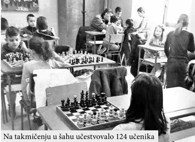
Na takmičenju u šahu učestvovalo 124 učenika

Školsko takmičenje u šahu lo 124 učenika. Ekipno su po- školi domaćinu poklonio šahovski sto za nastavu u predmetu šah koja se već drugu godinu odvija u školi „Svetozar Miletić“.