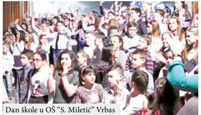
Dan škole u OŠ "S. Miletić" Vrbas

Poslednja sedmica u februaru u vrbaskoj OŠ "Svetozar Miletić", nazvana "Miletićevi dani", protekla je u znaku obeležavanja 22. februara - Dana ke večeri. U centralnoj priredbi učestvovali su brojni đaci koji su kroz pesmu, igru i recital još jednom predstavili svoje talente i znanja. Počelo je hi-