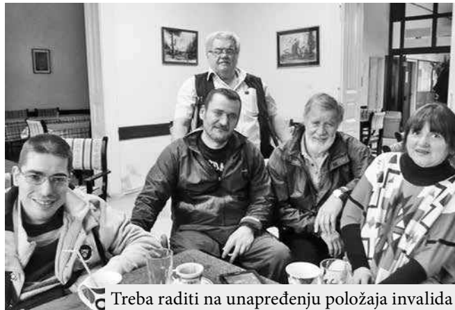
Treba raditi na unapređenju položaja invalida