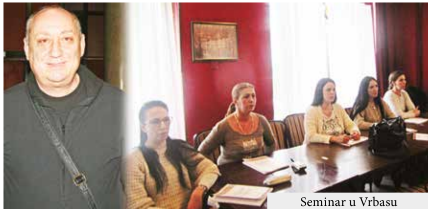
Seminar u Vrbasu

Seminar za rukovodioce folklornih grupa održan je u organizaciji Saveza umetničkih stvaralaca amatera Vojvodine u vrbaskom Hotelu Bačka od 10. do 16. februara. Domaćin seminara koji je okupio oko 110 polaznika iz zemalja regiona Mađarske, Crne Gore, Rumunije, kao iz di-