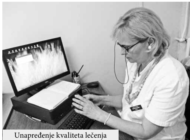
Unapređenje kvaliteta lečenja

Povodom Svetskog dana dece obolele od raka, koji je obeležen 15. februara, Opšta bolnica Vrbas je 19. februara organizovala akciju podrške porodicama dece obolele od raka u Ambulanti psihologa. U Srbiji svakog dana jedno dete oboli od raka. Zato je važno da se podigne svest javnosti da je unapređenje kvaliteta lečenja i života dece obolele od raka zajednička misija čitavog društva. Povodom Svetskog dana dece obolele od raka, Nacionalno udruženje roditelja dece obo-