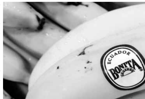
Cena i do 180 dinara za kilo

Tako su polovinom februara gi porast cene koji je karakterističan za svako proleće. Banane nisu jeftinije ni na pijakilogramu, dok su u pojedinim marketima banane bile pijacama kažu da je veća i na akciji i koštale oko 135 dinara. „Banane se nabavljaju iz nekoliko zemalja južne hemisfere, a za ovo doba godine je karakterističan sezonski pad proizvodnje“, kažu u ov-