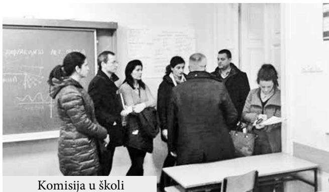
Komisija u školi

Poseta izabranim objektima, kao deo obaveznih koraka u realizaciji SECO projekta Švajcarskog ministarstva finansija u opštini Vrbas, realizovana je