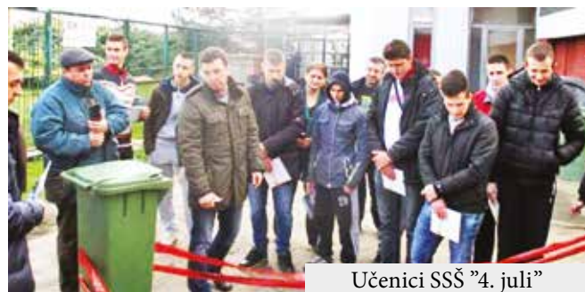
Učenici SSŠ "4. juli"

li vidni tragovi. Predstavnici JKP Standard odgovorili su i na raznorazna pitanja koja su im učenici postavili, ali su se