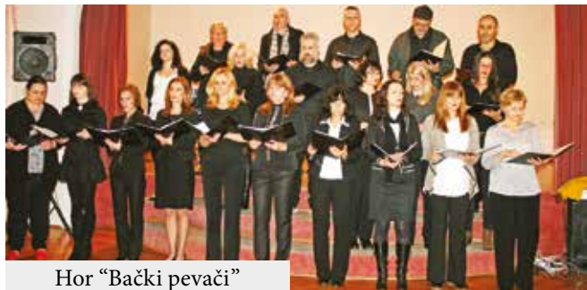
Hor "Bački pevači"

Kao gosti na koncertu su nastupali hor i orkestar KPD "Karpati", hor članova Kluba za stara i odrasla lista i sada već stalni gosti kao i sastavni deo gradskog hora, dečiji hor "Mali bački pevači". Svake godine dodeljuju su priznanja