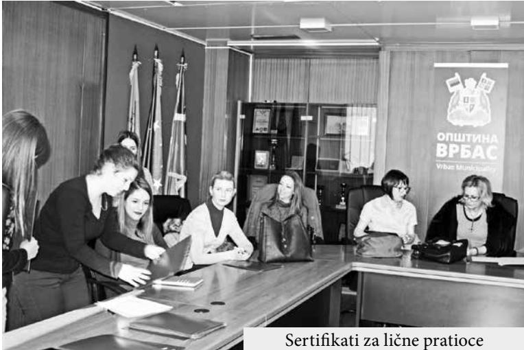
Sertifikati za lične pratiocice

Trodnevna obuka koju je ličnog pratioca deteta sa posebnim potrebama, a potvrdu bi ona zaživela. Tokom 2016.