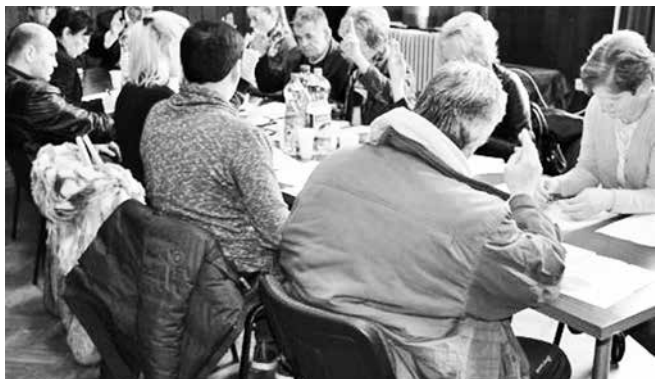
Sednica Opštinskog veća u Kuli

Na sednici Opštinskog veća, održanoj u Kuli 14. februara, za 2018. godinu. Ovim planom akcioni plan za zapošljavanje kojom je predsedavao zame- su predviđene mere aktivne