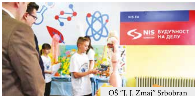
OŠ "J. J. Zmaj" Srbobran

U OŠ "Jovan Jovanović Zmaj" održan je šesti "Zmajev festival nauke". Ovo-puta festival je unapređen tere, projektore i table, koji će omogućiti izvođenje savremene i kvalitetnije nastave u ovoj školi. Zajedno sa ostalim broj-