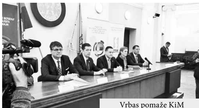
Vrbas pomaže KiM

Stalna konferencija grado- že naše sunarodnike na Koso- va i opština (SKGO) održala vu i Metohiji i upravo sada, u je, u saradnji sa Radnom gru- saradnji sa Južno-bačkim pom Vlade Republike Srbije upravnim okrugom, traje pri- za pružanje podrške vođenju kupljanje humanitarne pomo- unutrašnjeg dijaloga o KiM i ci koja će uskoro biti upućena u Ministarstvom državne upra- u južnu srpsku pokrajinu. Do