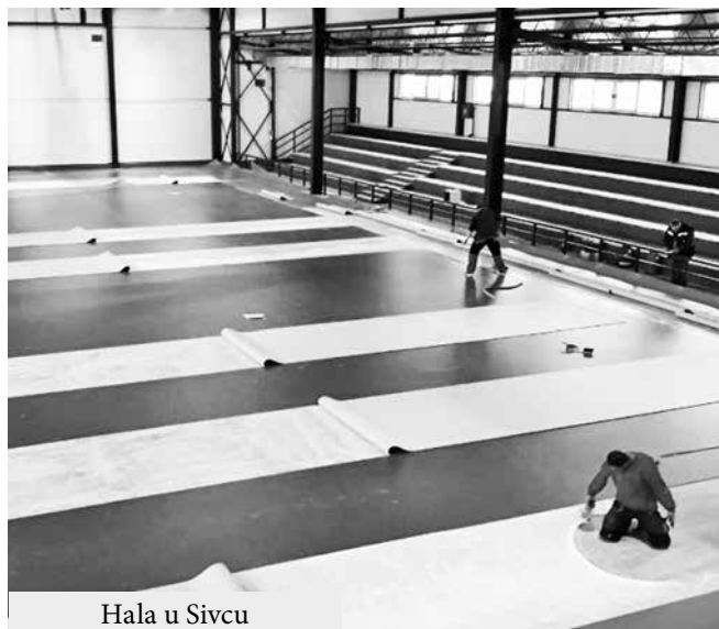
Hala u Sivcu

Nakon završetka postavlja- će osim sportskih u njoj moći nja podloge u novosagrađenoj da se priređuju kulturne i dru-