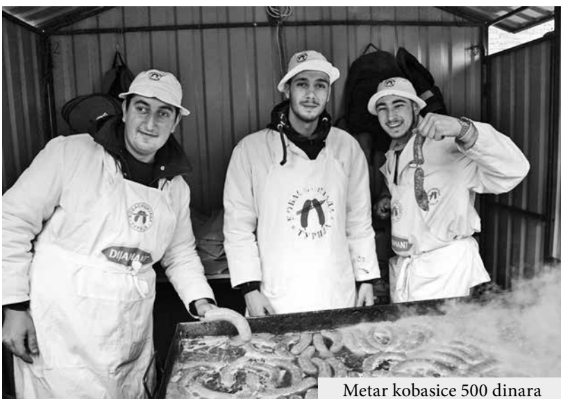
Metar kobasice 500 dinara

Čuvena manifestacija u Turiji – Kobasicijada održana je su stigli iz svih krajeva zemlje, ali i inostranstva. U subotu, ca koja je prodavana na me-put 34. put od 16. do 18. febru- tačno u podne izneta najdu- tar, po 500 dinara, „planula“