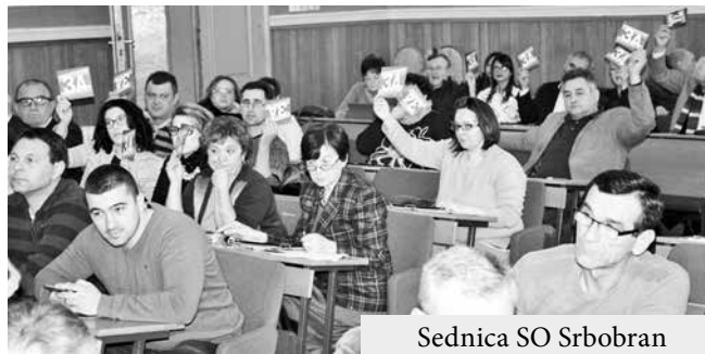
Sednica SO Srbobran

Na poslednjoj sednici Skup- vanja u poslednjem kvartalu štine opštine Srbobran doneto prethodne godine, smenjena je niz značajnih odluka. Izme- je direktorka dr Svetlana Ra- đu ostalih usvojena je Odluka jak. U izveštaju se navodi i da je deo sredstava za realizaciju je angažovanju eksterne revi- usvojenih projekata unapre- zije završnog računa budže- denja kvaliteta rada ostao ne- godinu, kao i Odluka o ime- utrošen, a pojedini programi novanju članova Nadzornog koji su osmišljeni u cilju zašti- odbora Društva sa ograniče- te i kontrole zdravlja građana, nom odgovornošću "Odma- nisu sprovedeni prema dogo- ralište Srbobran" i utvrđiva- vorenom planu. Dr Rajak, tvr-