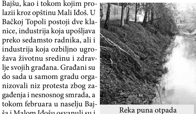
Reka puna otpada

pravo ozbiljno zagadila jedinu - reku Krivaju. Zagađena je tokom kojim prolazi kroz Bajšu, kao i tokom kojim prolazi kroz opštinu Mali Idoš. U Bačkoj Topoli postoji dve klanice, industrija koja upošljava preko sedamsto radnika, ali i industrija koja ozbiljno ugrožava životnu sredinu i zdravlje svojih građana. Građani su do sada u samom gradu organizovali niz protesta zbog zagađenja i nesnosnog smrada, a tokom februara u naselju Bajša i Malom Idošu osvanuli su i plakati kojima se građani međusobno pozivaju da potpuno zatrpaju jedinu reku Krivaju, u