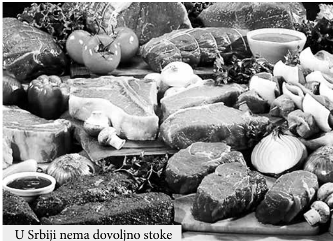
U Srbiji nema dovoljno stoke

Dok je na pašnjacima i u štala objašnjavaju da izvoza nema i lama sve manje stoke, na papi da ga još dugo neće biti, jer Sr- rima i u priči sve su veće mo- bija nema dovoljno stoke. Sr- gućnosti za izvoz mesa iz Srbi- bija, inače, ima potpisane spo- je. Država uklanja administra- razume o slobodnoj trgovini tivne prepreke, kako bi doma- i izvozu mesa sa dalekim ze- će meso stiglo do daleke Kine, mljama. Između ostalog, za