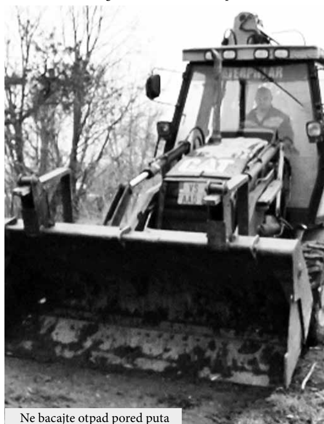
Ne bacajte otpad pored puta

Kako su saopštili iz JKP "Komunalac" na starom putu Vrbas - Srbobran nalazilo se više od 50 kubnih metara otpada koji je deponovan odmah po- red puta i na druga mesta koja 500 metara od ovog dela i ne-