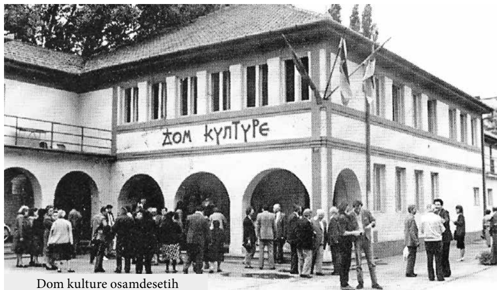
Dom kulture osamdesetih

stanovnika ovog grada učinilo je očigledno mnogo, kada ove institucije kulture traju, posto-