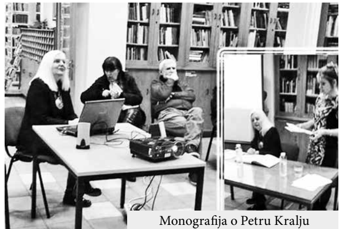
Monografija o Petru Kralju

Monografiju posvećenu Petru Kralju, velikom glumcu, vladaru pozorišne scene ili kako Anita Panić, autorka razgovoru, umetničko delo kaže, u uvodnom delu knjige, „čovjeku sadašnjeg trenutka, koji je znao biti tužan kada ga kritika nije razumevala, a u glumačkoj karijeri igrao čak 44 godine. Autorka je govorila počinje tamo gde zanat pre-