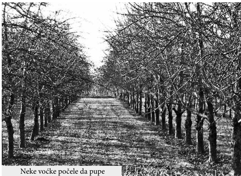
Neke voćke počele da pupe

Početak ove 2018. godine, a tanja vegetacije, odnosno do naročito njegova druga polo- faze pucanja pupoljaka, a kod vina doneli su jako toplo vre- nekih voćnih vrsta i do cveta- vreme koje se kretalo i do 18 ste- nja (kajsija). Kretanje pupolja- peni celzijusa, pa je primećeno- ka je vidljivo kod koštičavih vrsta voća, breskve i trešnje, le da pupe. Izrazito tople vre- dok kod jabučastih vrsta pu-