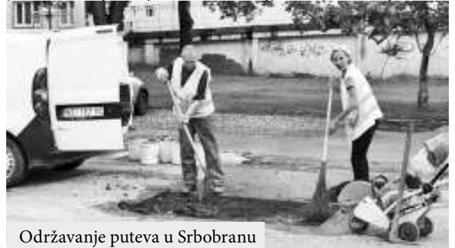
Održavanje puteva u Srbobranu

sledećim ulicama: Njegoševa, Šajkaška i Miloša Crnjanskog. Ovo je samo početak