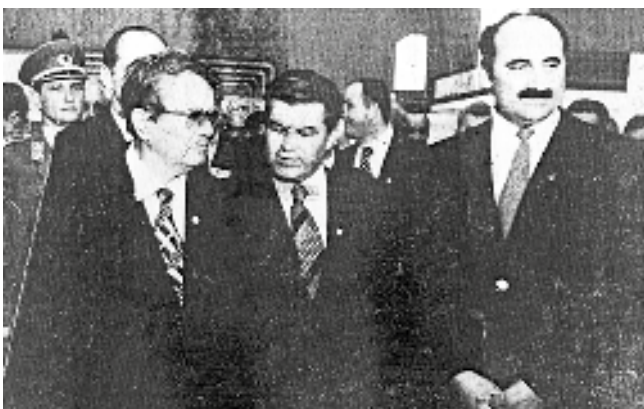
Tito u pratnji Nikole Dragina i Stevana Tadića 1976. god.

dobri odnosi u privredi, bez toga ne može da se radi. Pri- vatizacija je bila pljačka, oti- mačina onoga što su genera- cije stvarale, a niko nije odgo- varao“, smatra Tadić i dodaje da mu je najžalije Kombinata i grada. „U moje vreme naša opština je bila druga ili treća