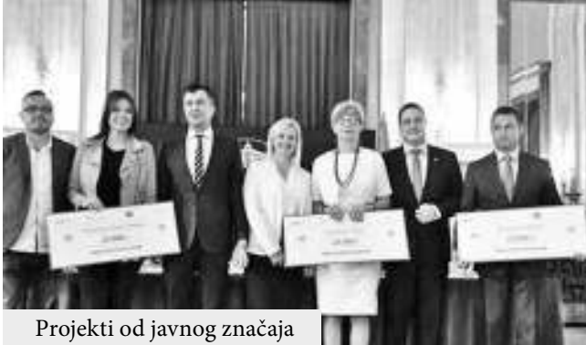
Projekti od javnog značaja