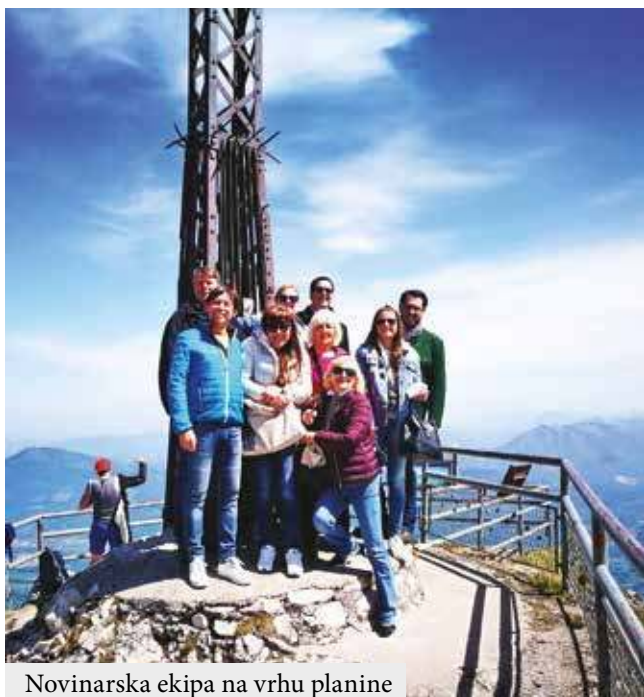
Novinarska ekipa na vrhu planine

kažu domaći „šnaps“ od šišarki, koji je imao ukus eliksira snage i energije, možda one energije o kojoj je kako