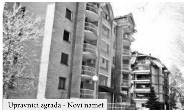
Upravnici zgrada - Novi namet

jednica, odnosno registraciju stambene zajednice i upis upravnika podnelo je ukupno 104 stambene zajednice. Ono što građane najviše in-