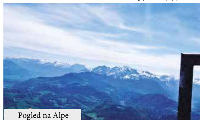
Pogled na Alpe