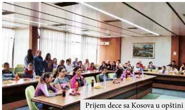
Prijem dece sa Kosova u opštini

jedni druge, učimo jedni od drugih, a ovo je i prilika da se naši gosti upoznaju sa Vrbasom koji ima mnogo toga