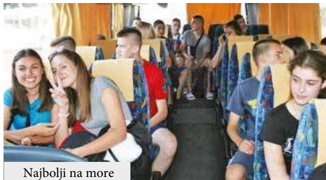
Najbolji na more

Opština Srbobran nagradila je Vukovce iz svih škola u je krajem juna u Sutomotoru i vratili su se puni lepih utisa-