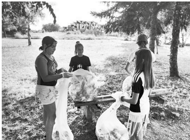
Lazin park očistili volonteri

Park u Ulici Laze Kostića, poznatiji i kao „Lazin park“, mladi volonteri su kroz još jednu akciju, uredili i osvežili. Time su pokazali da se školski raspust, osim u zabavi i odmoru, može provesti i u druženju i kroz koristan rad koji će služiti na doborbit šire zajednice. „Uz razumevanje i susretljivost Nenada Mikića, predsednika SU „Lazin Park“ u Vrbasu, volonteri Ekološkog pokreta Vrbasa i Crvenog krsta Vrbasa, uz lepo druženje, očistili su zeleni prostor oko sportskih terena ovog udruženja, ofarbali česmu, pripremili i ofarbali 20-tak klupa. Tehnički organizator akcije bio je Ekološki pokret Vrbasa“.