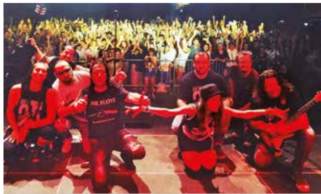
Demo fest – najbolji bend Džem, kajmak i marmelada

Ovaj Festival pokrenut je na inicijativu članova benda Ničim izazvan, a zahvaljujući humanosti iskazanoj prethodne godine, prikupljeno je pola miliona dinara za opremanje kuće za dnevni boravak za decu sa posebnim potrebama. Punu podršku festivalu od samog osnivanja pruža i opština Vrbas.