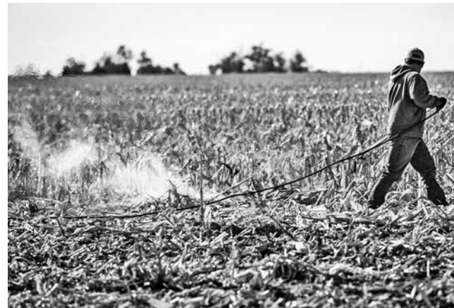
Zabranjeno i opasno paljenje žetvenih ostataka

Nastavlja se po planu fabrika šećera. Prinosi se kreću od 5-6 vagoda /ha plative repe, a digestija varira i zavisi od terena i samih proizvođača i kreće se od 13-16% bar po