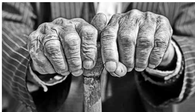
Više od 65 godina ima 20,7% stanovništva Srbije

Crveni krst Vrbas obeležio je 1. oktobar - Međunarodni dan starijih osoba. Za ovu priliku u prostorijama Crvenog krsta, organizovano je druženje volontera starije generacije sa kolegama iz Udruženja penzionera, Aktiva žena i drugih organizacija koje okupljaju starije osobe. "Ove, 2020. godine, obeležava se 75. rođendan Ujedinjenih nacija i 30. rođendan Međunarodnog dana starijih osoba. Takođe, 2020. godinu je obeležila pandemija COVID 19. Uzimajući u obzir da je rizik za obolevanje veći među osobama starije životne dobi, javnozdravstvene politike i programi su obuhvatili promotivne aktivnosti sa ciljem podizanja svesti o njihovim posebnim potrebama. Takođe je važno prepoznati odgovornost starijih osoba prema sopstvenom zdravlju i njihovu ulogu u fazama spremnosti i reagovanja na tre-