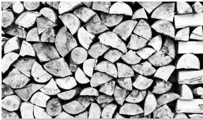
Cene uglja i drva

i onih koji obilaze stovarišta, sve je bolja i prodaja, a očekuje se da pravi sezonski pazar tek počne narednih dana. Oni koji kreću u kupovinu uglja i drva, kako kažu na stovarištima, ove grejne sezone imaju gotovo isti trošak kao i lani jer praktično poskupljenja nema, ili je neznatno. A koliki će trošak biti zavisi od vrste energenta koji se koristi, kvaliteta izolacije domaćinstva, veličine stambene površine, spoljnih temperatura... Nije svesjedno da li se kupi drveni uglalj ili onaj kvalitetniji, koliko se koristi drveta... Ipak, s velikom sigurnošću bi se moglo reći da grejna sezona ne može proći bez oko 35.000 dinara, odnosno da će najmanje toliko novca biti potrebno da se zagreje oko 60 kvadratnih metara stambene površine. Naravno, u slučaju da su svi parametri idealni – od izolacije do najpovoljnije cene ogreva, što zavisi i od toga gde se kupuje. Međutim, izvesnije da je će trošak za nastupajuću grejnu sezonu biti oko 40.000 dinara.