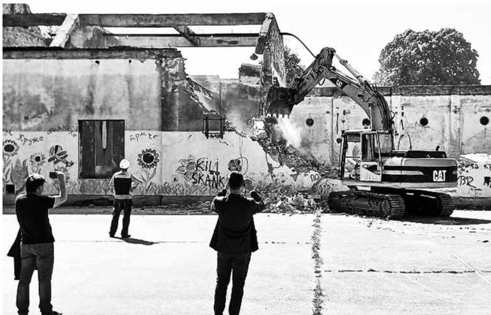
Ravno Selo Film Festival od 1. do 4. jula

Pokrajinske vlade Vojvodine Igoru Miroviću na pomoći i razumevanju u izgradnji novog Doma kulture u Ravnom Selu. U ovaj projekat uključena je i MZ Ravno Selo, koja aktivno učestvuje u organizaciji, i svi se trude se da budu dobri domaćini.