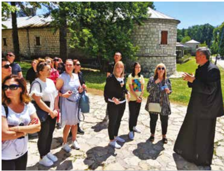
Prva poruka novoizabranom mitropolitu od Vrbašana

metara visok svod kapele prekriven mozaikom sa 200.000 zlatnih pločica (donacija iz Italije). U kripti Mauzoleja nalazi se Njegošev grob. Obuzele su većinu neverovatne emocije. Potreba da se poklonimo i budemo zahvalni što imamo priliku da stojimo pred njegovim grobom. A onda, vidikovac guvno. Impresivan pogled na veliki deo Crne Gore... Zaista prelepo”, utisak je jedne od putnica.