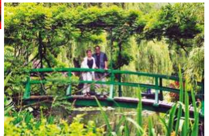
Uveo revoluciju u slikanje

Iako je svoj razvojni put započeo kao figuralni slikar: „Doručak na travi“ ili „Japanka sa lepezom“, u jednom trenutku je odlučio da se posveti pejzažima i uveo revoluciju u slikanje. „Lokvanji“ su kolekcija od oko 250 slika, koje je Mone stvarao tokom 30 godina u bašti Živernija, imanja koje je kupio za svoju porodicu i gde je izgradio ribnjak sa egzotičnim biljkama. Ova serija slika za njega je postala svojevrsno utočište i likovna terapija u vremenu sukoba i turbulencija tokom Prvog svetskog rata. Slikao ih je u različito doba dana i u različito doba godine, i oni spadaju u jednu od najbrojnijih grupa u istoriji umetnosti kada je ista tema u pitanju. Kako je stario, njegovi radovi su postajali sve apstraktniji, a lokvanji su mu dali priliku da pojednostavi svoj stil i da se fokusira na formu i boju. Pred kraj 86. godina dugog života je sanjao „nešto što je nemoguće naslikati - vodu sa travom koja se talasa u dubini“. Ovo je rezultiralo time da ga njegov kolega ništa manje poznati Eduar Mane nazove „Rafaelom vode“.