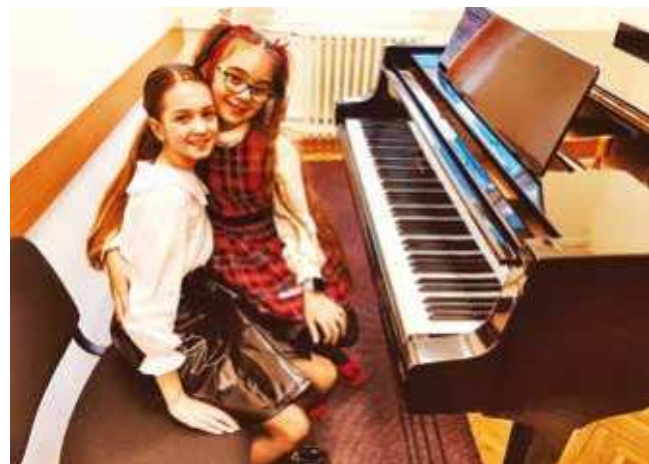
Koncert nastavnika muzičke škole