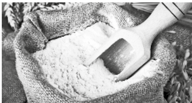
Ograničenja se odnose na manja pakovanja brašna

dinara po kilogramu. Maksimalna proizvođačka cena ovog brašna određena je na 40,9 dinara po kilogramu. Takođe, kao i ranije, država je propisala da proizvođači moraju da isporuče trgovcima mesečno najmanje 50 odsto isporučenih količina iz istog perioda prošle godine. Pored toga, limitirano je i koliko svaki kupac može da kupi brašna. Trgovac može