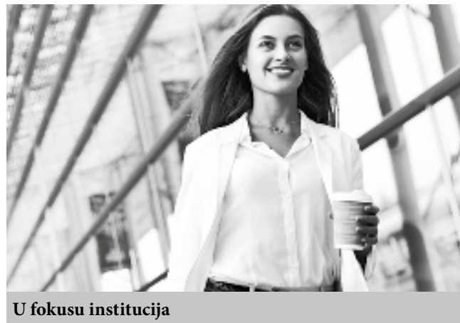
U fokusu institucija

Šta više, procenat žena sa fakultetskom diplomom koje traže posao, danas je veći nego 2011. godine.