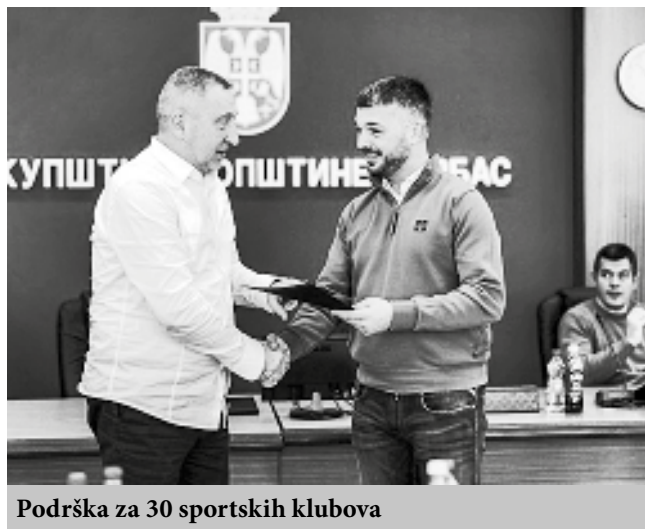
Podrška za 30 sportskih klubova