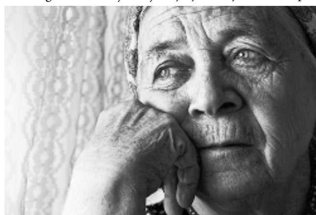
Penzije manje od 20.000 dinara