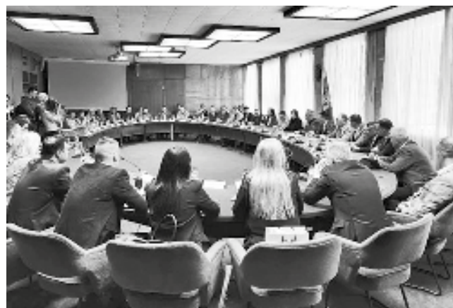
Za Srbobran skoro 1,7 miliona

prazne pepeo, čađ i druge nusprodukte zastarelih vidova grejanja", istakla je Aleksić.