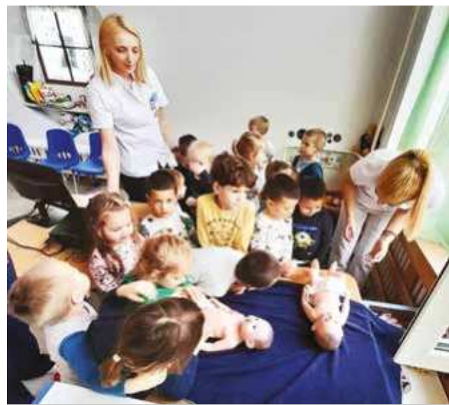
Deca treba da prave igračke

Delatnost se sprovodi kroz odojčce, malo dete od 2 godine, malo dete od 4 godine, odraslo stanovništvo prema indikacijama i stariji od 65 godina. Patronažna služba