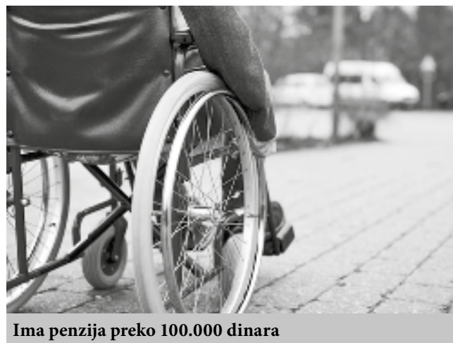
Ima penzija preko 100.000 dinara

Broj penzionera u Srbiji se, prema zvaničnim podacima Fonda za penzijsko i invalidsko osiguranje (PIO), smanjuje iz godine u godinu, pa je od decembra 2015. do oktobra prošle godine broj korisnika penzija smanjen sa 1.735.942 na 1.646.903, dakle za skoro 90.000. U ovom periodu broj ljudi na platnom spisku Fonda PIO, godišnje se smanjuje uglavnom za po oko sedam-osam hiljada, a najve-