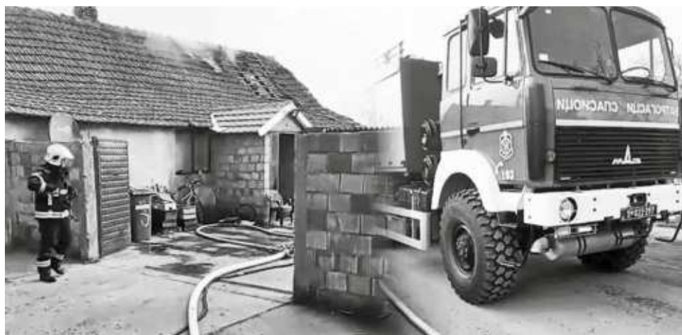
Vojska humanih ljudi se pokrenula