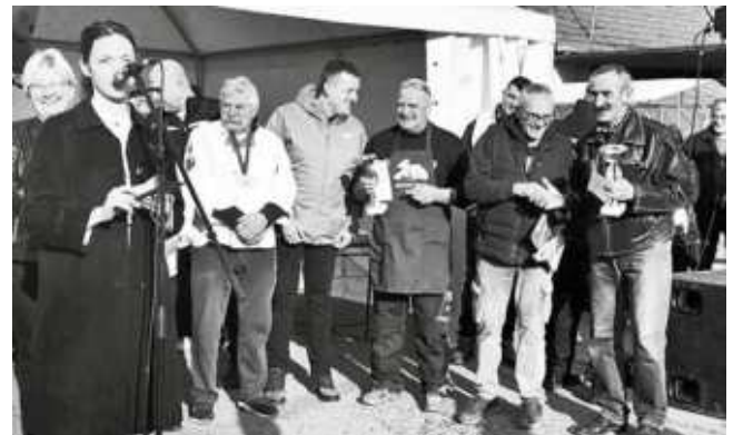
Sredstva u humane svrhe