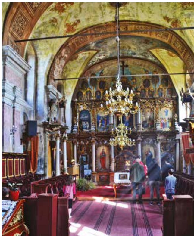
Uskrs ili Vaskrs?

Različite kulture su dodale i još neke običaje za Uskrs. U Srbiji se jagnjetina jede na Uskrs samo ako je pre njega proslavljen Đurđevdan. U Italiji se praznik slavi porodično uz bogatu trpezu na kojoj su obavezna jagnjetina, torta paskvalina, slano jelo od spanaća i jaja. Slovačka i deo Mađarske Uskrs proslavljaju i specifičnim ritualom šibanja vrbom ili polivanja vodom povorke devojaka ili žena koje prolaze ulicama. Veruje se da je vrba simbol plodnosti, pa otuda ovi običaji za Uskrs, a žene i devojke tom prilikom posmatračima, „mučiteljima“, poklanjaju ukrašeno jaje. U Francuskoj se posle obavezne porodične uskrsnje mise kreće u lov na jaja koja je domaćica ili neko od ukućana rano ujutro ili noć pre praznika sakrio po bašti ili u kući.