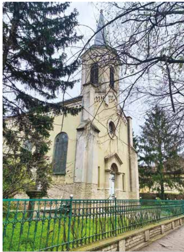
Uskrs u različitim kulturama

preminuli preci daruju se jaja koja se za ovu priliku boje dan ranije. Četrdeset dana posle Uskrsa slavi se Spasovdan, Vaznesenje Gospodnje, dan kada se Hrist još jednom javio učenicima i naočigled njih uzneo na nebo.